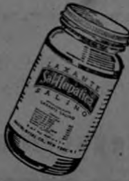
Un producto de Bristol-Myers Co.

10AM.— ¡Mamá tenía razón! El casamiento resulta magnífico y el padrino Julián anima la fiesta con un buen humor. Con razón, Sal Hepática tiene, entre otras ventajas, la de que, tomada en ayunas, hace efecto en poco tiempo. Pregunte usted a su médico que le parece la fórmula de este laxante salino y efervescente. Sal Hepática también ayuda a combatir la hiperacidez gástrica.